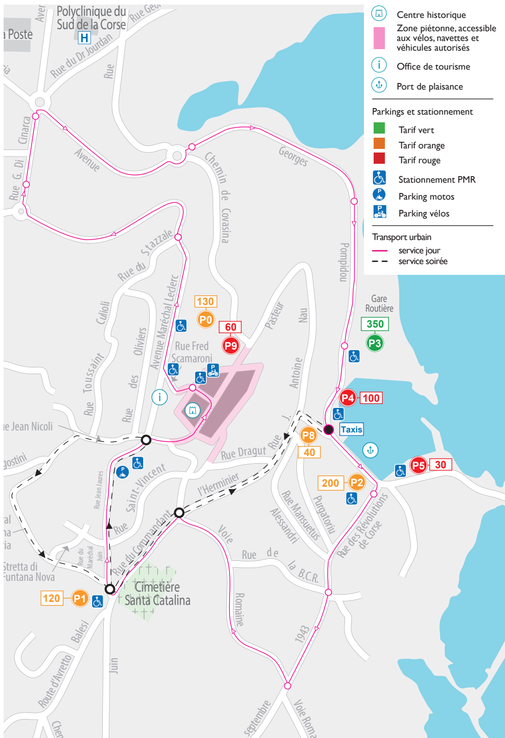
La mobilité dans la zone urbaine, vue d'ensemble.